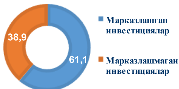
2019 йил январ-июн